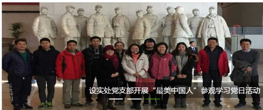
设实处党支部开展“最美中国人”参观学习党日活动